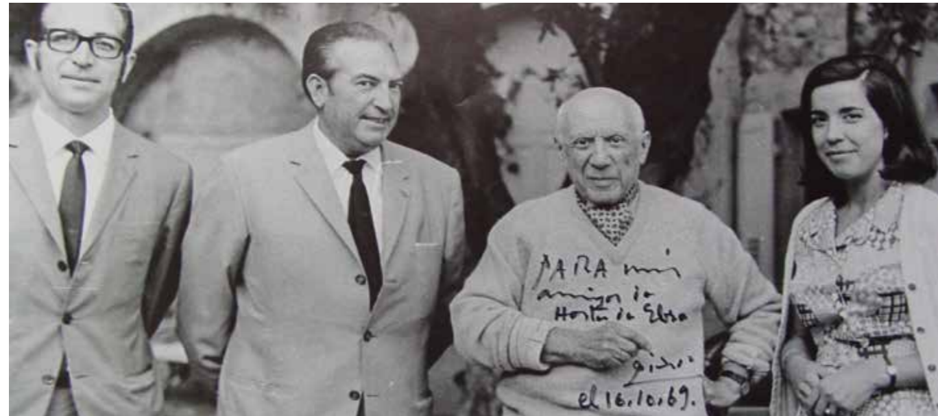
Picasso "y sus amigos de Horta de Ebro".